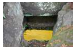
実篤公園のヒカリモ