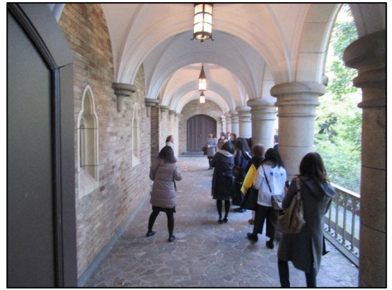
回廊 (VIP ロード)