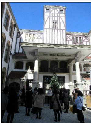
坪内博士記念演劇 博物館